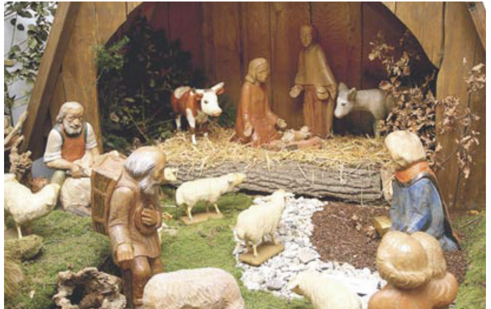
Die Krippe aus St. Marien stand die letzten Wochen im Heimathaus Noldes in Ammeloe. Demnächst wird die KAB St. Marien sie im Hochchor der Stiftskirche aufbauen.