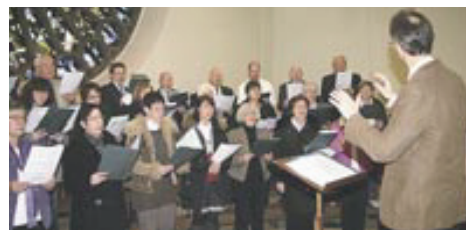
Kirchenchor St. Marien bei einem der letzten Weihnachtssingen